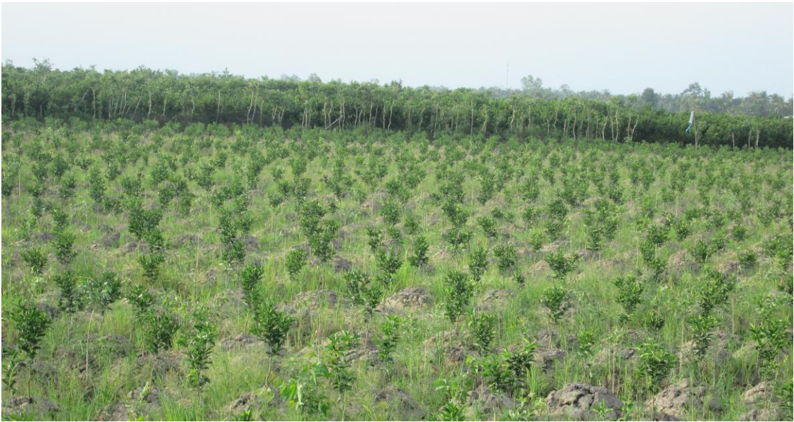
a) Vườn cam sành