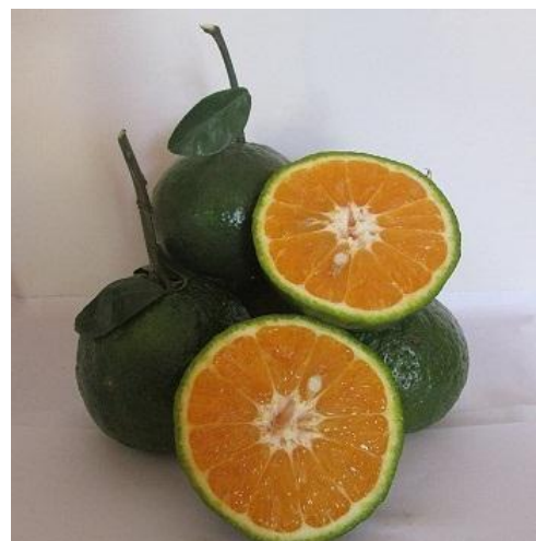
e) Sản phẩm tiêu dùng