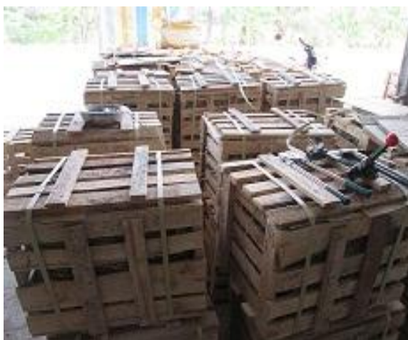
d) Đóng gói