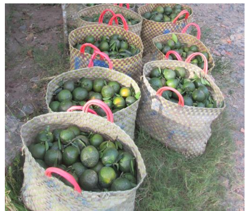
c) Thu hoạch và phân loại