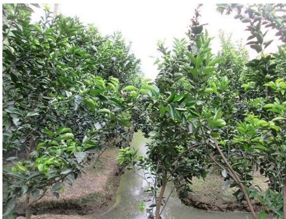
b) Khi cây bắt đầu ra trái